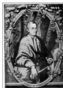
Ян Баптист Ван-Гельмонт (1577 – 1644г.), голландец, естествоиспытатель.

За полезные науке заблуждения в 1889 году (через 245 лет после смерти) в Брюсселе ему воздвигли памятник.